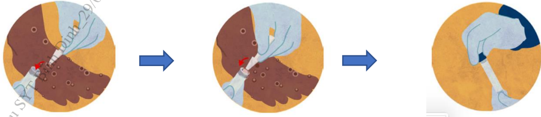
Hình ảnh minh họa về lấy mẫu da/vảy khô từ vết tổn thương

thương): sử dụng panh kẹp hoặc dụng cụ gấp (có đầu không sắc) vô trùng để gấp toàn bộ hay một phần da/vảy khô (kích thước ít nhất 4mmx4mm) rồi cho vào ống vô trùng (ống 1,5ml hoặc ống 5ml) không chứa môi trường vận chuyển. Sử dụng băng cá nhân để băng lại vết thương sau khi lấy mẫu.