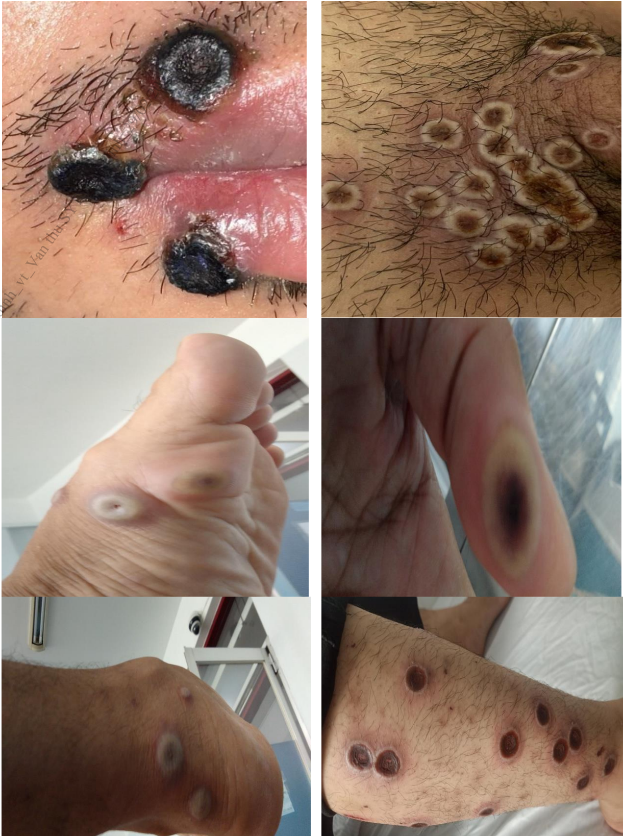
Hình 2. Hình ảnh tổn thương sâu