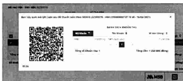
Giao diện quét mã QR Code MoMo

- Chọn các khoản thu cần đóng, sau đó chọn vào biểu tượng ví điện tử MoMo, màn hình máy tính sẽ hiển thị QR Code của các khoản thu bạn đã chọn.